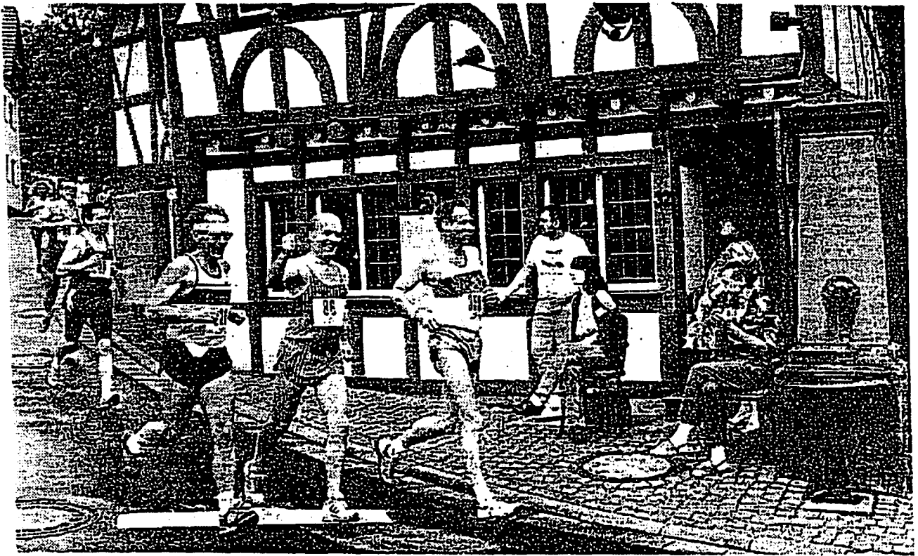
Abenteuer Burglauf: Das sind 7 777 Meter von der Burg bis hinunter in Eppsteins historische Altstadt.