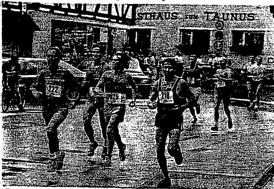
Eppsteiner Zeitung vom 4. Juli 1990

Am vergangenen Wochenende herrschte wieder Hochbetrieb auf der Burg und um die Burg! Vor dem »Klassiker«, den Burgfestspielen, die am Samstag mit Shakespeares »Kaufmann von Venedig« vor ausverkauftem Haus (Fotos oben) fortgesetzt wurden, hatten am Freitagabend die Läuferinnen und Läufer ihren großen Auftritt beim 5. Eppsteiner Burglauf (Foto unten). Dieses Rennen über die »altdeutsche Meile« verspricht zum »Klassiker« der Lauftruffs zu werden. Von Jahr zu Jahr starten prominenter Teilnehmer. Mehr über den Rekord-Sieg des deutschen Berglaufmeisters Münzel und die weiteren Ergebnisse auf Seite 7. Übrigens: Zum Abschluß der Burgfestspiele gastiert am kommenden Samstag, 20.30 Uhr, das Frankfurter Volkstheater mit Goldonis Komödie »Der Lügner« auf der Burg.